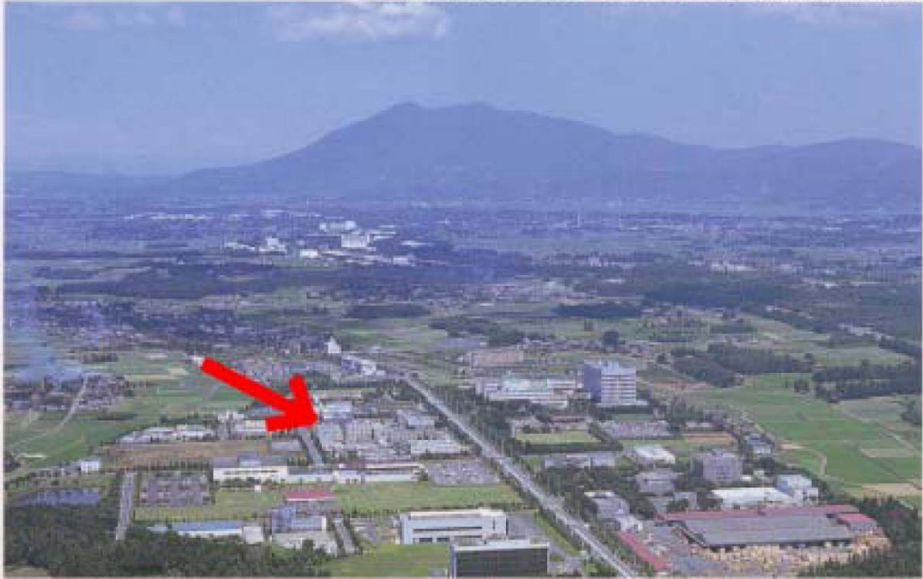
Aerial view of the Tokodai Research Park and Mount Tsukuba